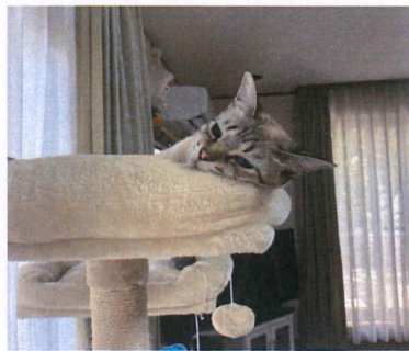
愛猫メルちゃん お気に入りの場所でウトウト…