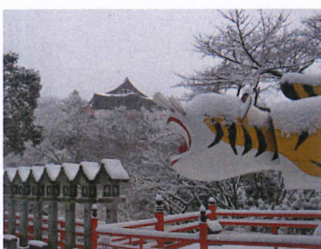
雪化粧をした張子の寅さん