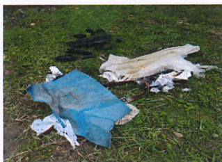
川で拾ったゴミたち…