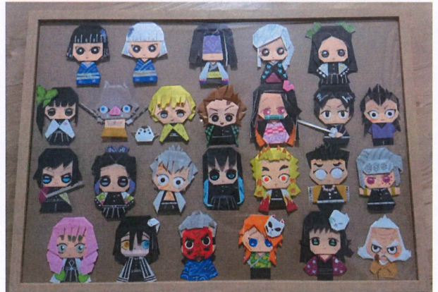
→息子達が作ったキャラクター折り紙