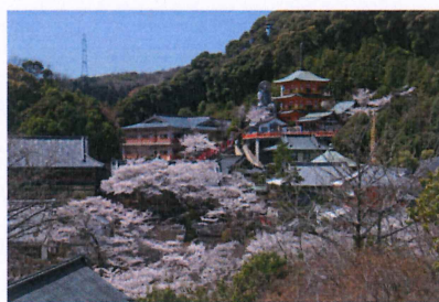
春には桜の名所となります