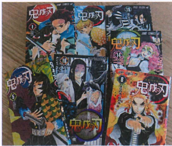
↑コミック「鬼滅の刃」

皆さん、新型コロナウイルスの影響で、 自粛生活 が続く中、いかがお過ごしですか？ 我が家にも小学5年生と中学2年生の男の子がおり、家で大人しく過ごすことが難しい感じがありました。ですが「 鬼滅の刃 」というアニメに出てくる キャラクター を 折り紙 で作るという動画サイトを妻が見つけて一緒に1つずつ作り始めてからは、長い家での時間を多少、大人しく過ごせるようになったと思います。私はこの「 鬼滅の刃 」というアニメを知らなかったのですが、ストーリーは、 大正時代を舞台に主人公が家族を殺した「鬼」と呼ばれる敵や鬼と化した妹を人間に戻す方法を探るために戦う姿を描いた話 で子供に勧められて コミック を読み、とても面白く私もハマってしまいました。皆さんも機会があれば是非読んでみてください。