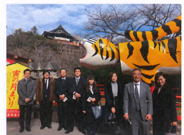
今年のお正月の1枚です