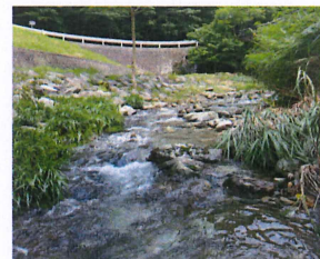
川の水はキンキンに冷たくて とっても気持ち良いです！